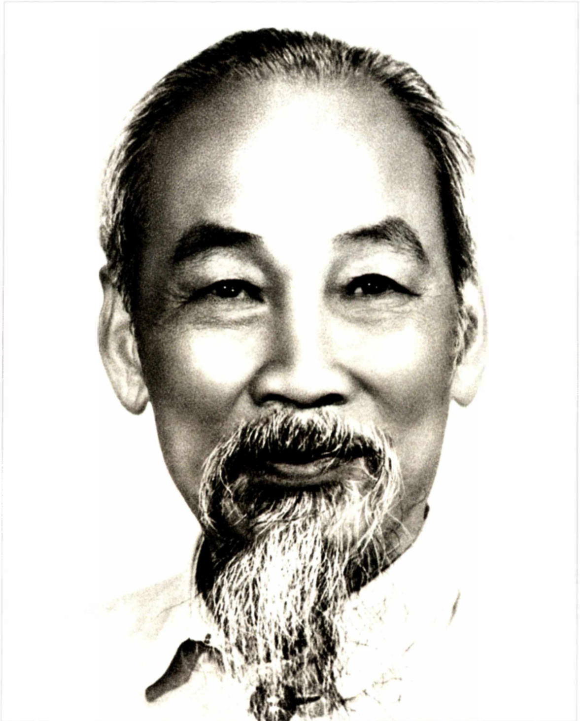
Chủ tịch Hồ Chí Minh President Ho Chi Minh (1890 - 1969)